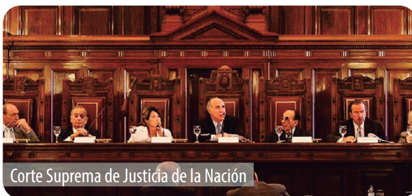
Corte Suprema de Justicia de la Nación

También asistirán a un juicio oral y a otros Tribunales de la Capital Federal.